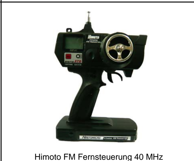
Himoto FM Fernsteuerung 40 MHz