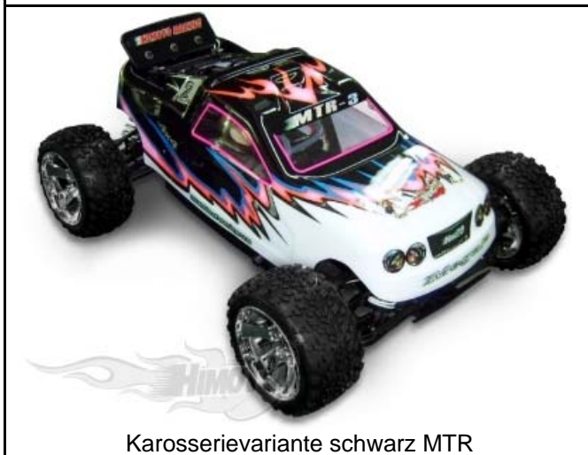
Karosserievariante schwarz MTR