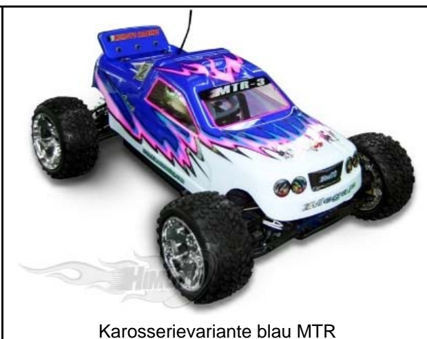
Karosserievariante blau MTR