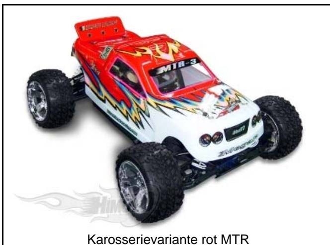
Karosserievariante rot MTR