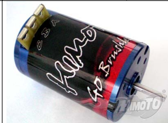
Leistungstarker BL Motor 9,5T