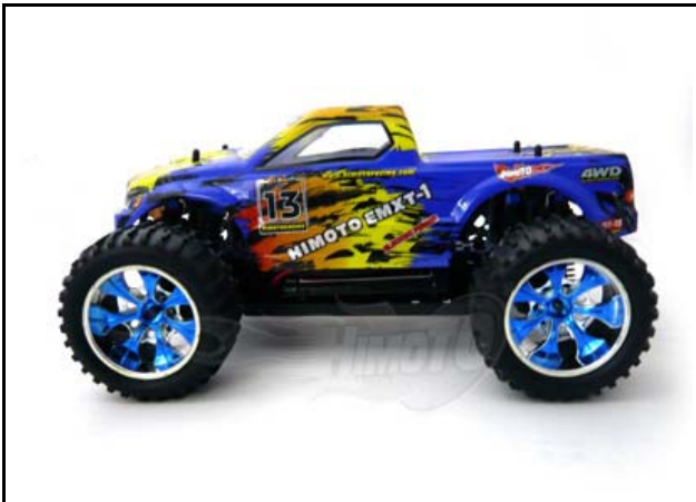
Chromfelgen mit Niederquerschnittsbereifung