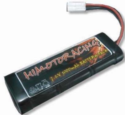
7,2 V 3000 mAh Akku enthalten