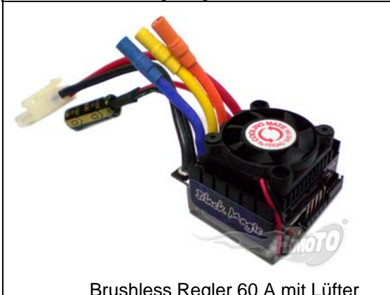
Brushless Regler 60 A mit Lüfter