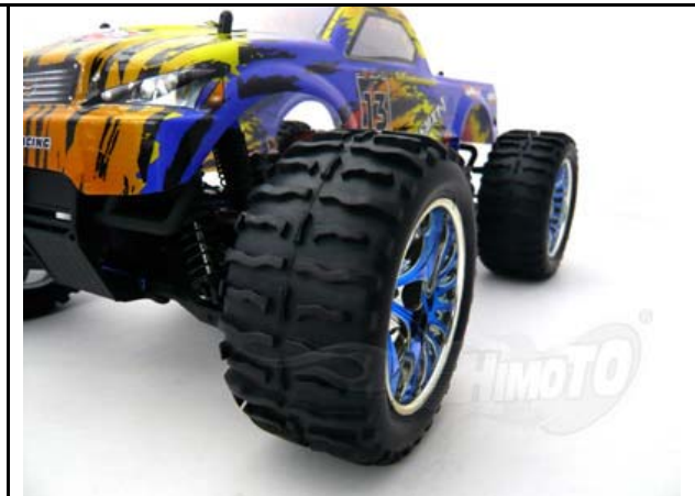
Reifen mit 118 mm Ø mit griffigen Profil